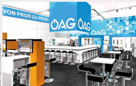
Im Mittelpunkt der blauen ÖAG Welt in Wels stehen orangefarbene interaktive Energiecorner.