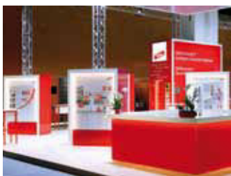
Das Team von DEHN AUSTRIA freut sich, Sie auf den Power-Days 2017 begrüßen zu dürfen

Weitere Informationen: Tel.: 07223/80 356-0 www.dehn.at