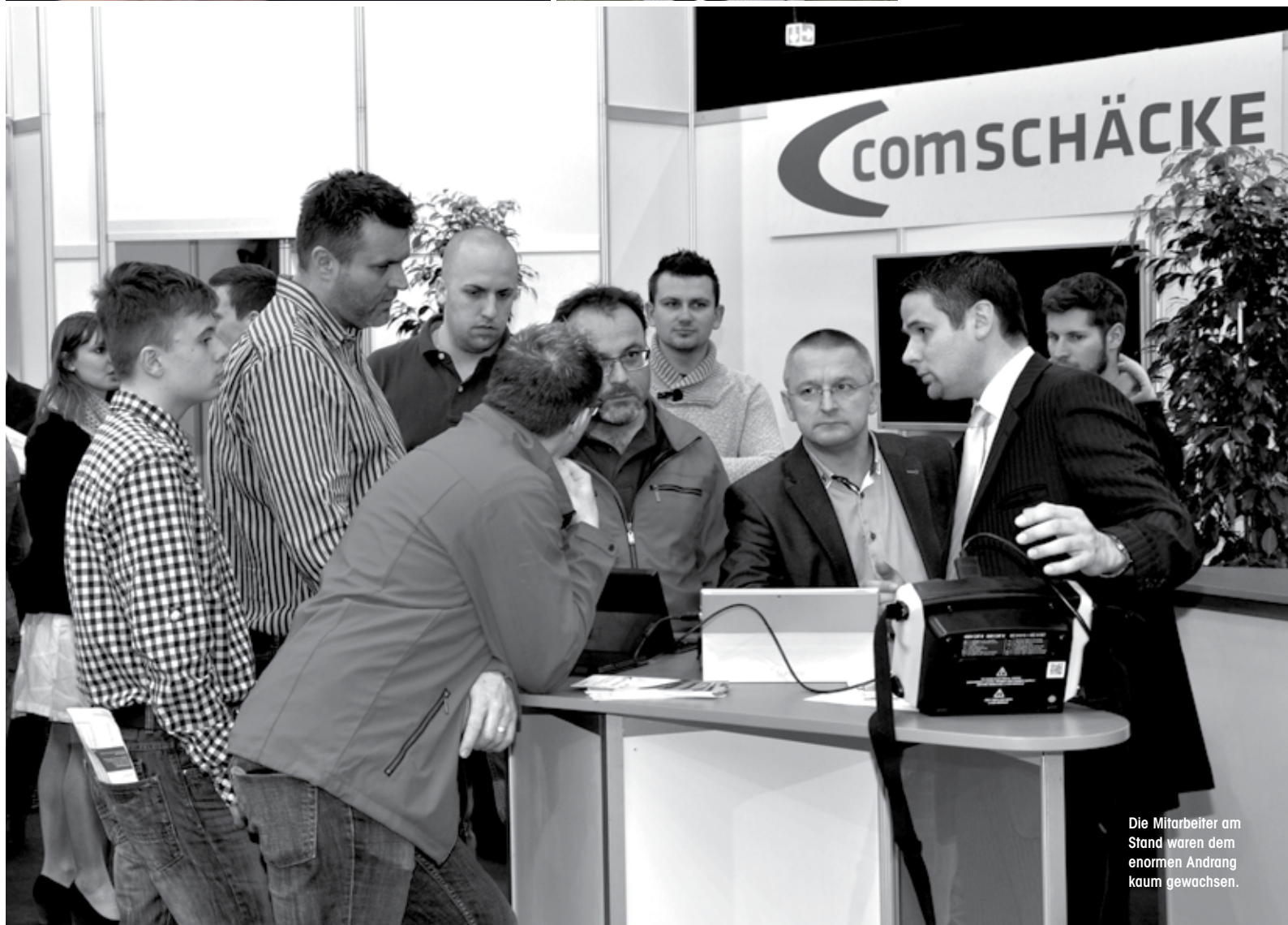
Die Mitarbeiter am Stand waren dem enormen Andrang kaum gewachsen.